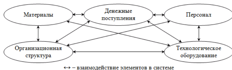
Рисунок 3. Элементы коммунальной системы

Внутренние элементы управляемой системы представлены на рисунке 3.