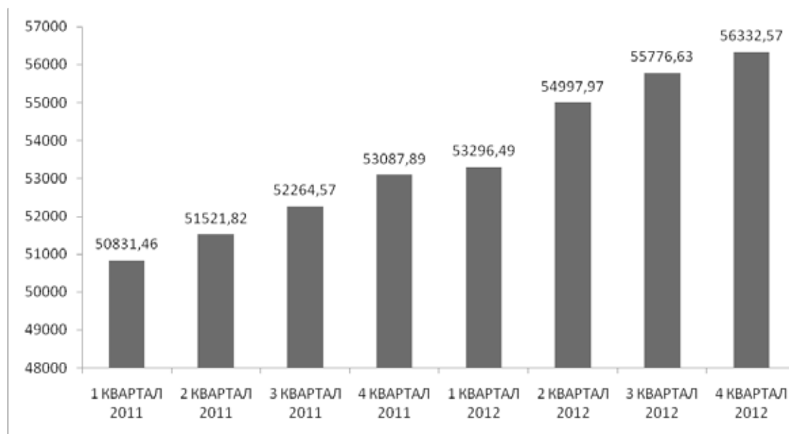
Рис. Средняя цена за 1м 2 в России за 2011-2012гг.

Неэффективность мер, направленных на регулирование рынка жилья заключается в том, что данный комплекс носит прямой дотационный характер, воздействуя лишь на часть участников