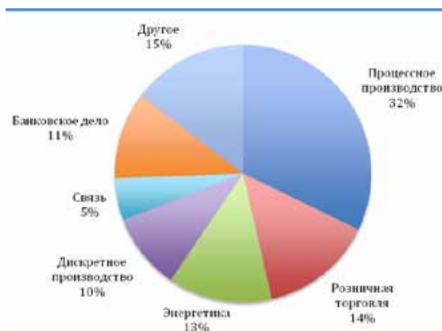
Рис. 2. Отраслевая структура потребителей ERP в России 2011 г.

выше среднего темпа роста российского рынка ИТ. Столь высокий даже по сравнению с предыдущим, успешным, годом рост рынка ERP обусловлен продолжающимся ростом российской экономики и инвестиций в ИТ, усилением конкуренции в ведущих отраслях. Помимо крупных компаний, решения ERP активно внедряли предприятия малого и среднего бизнеса. Положительно сказались на темпах роста российского рынка ERP в 2007 г. и усилия поставщиков, направленные на расширение партнерской сети, увеличение доли не прямых продаж, особенно в регионах. В 2008 объем российского рынка интегрированных систем управления предприятием году достиг 606,56 млн. долл. США, что соответствует ежегодному приросту на 4,7%.