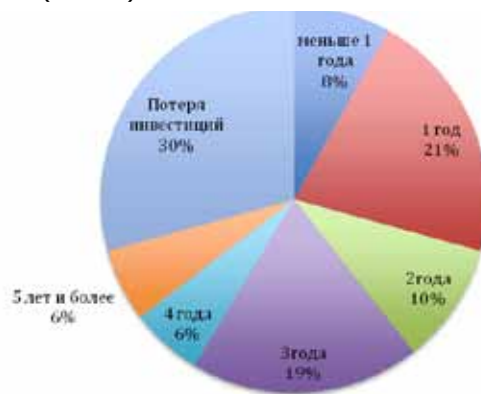
Рис. 3. Время возврата инвестиций в ERP-проект

Ведущими потребителями на российском рынке ERP в 2011 г. остались предприятия непрерывного производства. Второе место, сохранилось за розничной торговлей. На третье место в списке наиболее прибыльных для поставщиков ERP отраслей поднялось энергетика. На четвертой и пятой позициях следовали оптовая торговля и бизнес-услуги, которые впервые вошли в пятерку ведущих отраслей-потребителей ERP благодаря активности предприятий среднего и малого бизнеса (Рис. 2).